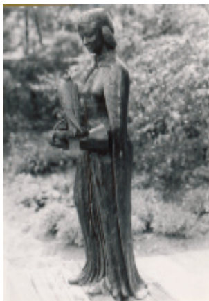
Standbeeld door Ricky Wijsbek

Hoewel zij, als kind van haar tijd, ingezet werd in het politieke machtsspel van haar vader, heeft zij een aanzienlijke bijdrage geleverd in de posities van haar vader en beide echtgenoten. Rond 1238 stichtte zij Klooster Binderen in Helmond. Zij heeft een stempel gedrukt op het religieuze, culturele en literaire leven in haar omgeving.