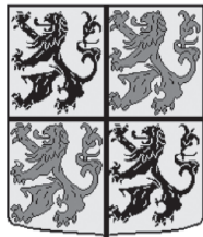
Het wapen van De Beerzen